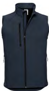
141M Herren Softshell Weste GRÖSSEN XS-2XL