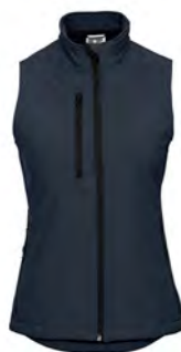
141F Damen Softshell Weste GRÖSSEN XS-2XL

Unsere Outdoor-Softshell-Jacken haben eine dreilagige Konstruktion. Die äußere Lage besteht aus einem glatten, gewebten Softshell-Stoff, der guten Wetterschutz bietet und sich problemlos dekorieren lässt. Die innere Lage in Hautnähe ist aus superweichem Microfleece und bietet Komfort und Wärme. Das Besondere an der Jacke ist jedoch die mittlere Lage; eine Hi-Tech-Membran, die Körperfeuchtigkeit nach außen entweichen lässt, ohne dass Regen eindringen kann, wodurch Schutz und Tragekomfort gewährleistet wird.