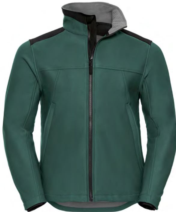
018M Strapazierfähige Workwear Softshell-Jacke GRÖSSEN XS-4XL

Die Workwear Softshell-Jacke von Russell mit strapazierfähigem Material, ergonomischem Design und einer durchdachten Ausstattung für vielfältige Arbeitsumgebungen.