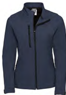
140F Damen Softshell Jacke GRÖSSEN XS-4XL