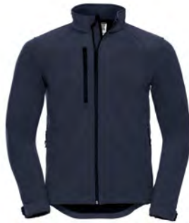
140M Herren Softshell Jacke GRÖSSEN XS-4XL